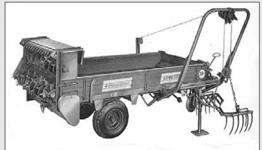
Streublitz mit Seitenlader von 1957

In Sachen Stabilität, Langlebigkeit und Flexibilität setzt Strautmann Maßstäbe. Hohe Belastbarkeit und lange Lebensdauer sind die wichtigsten Punkte, die einen Streuer auszeichnen.