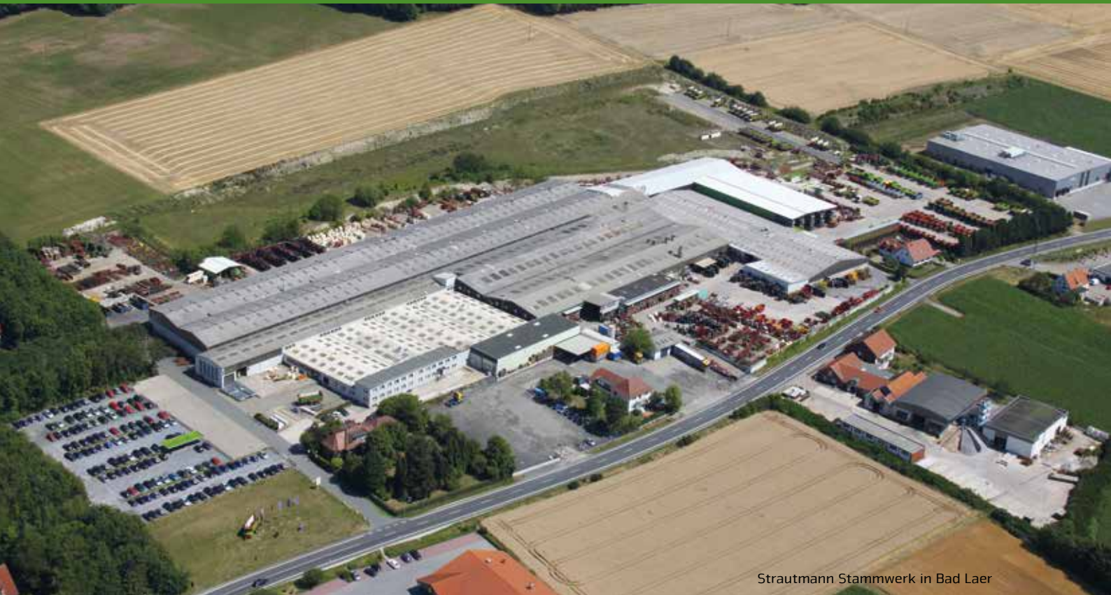
Strautmann Stammwerk in Bad Laer

Das Unternehmen B. Strautmann & Söhne GmbH u. Co. KG ist ein mittelständisches Familienunternehmen im Landkreis Osnabrück, das nun nach über 80-jährigem Bestehen in der dritten Generation geführt wird. Am zweiten Produktionsstandort in Lwówek (Polen) produziert Strautmann in einem modernen Werk neben einzelnen Maschinenkomponenten auch Teile des Maschinenprogramms,